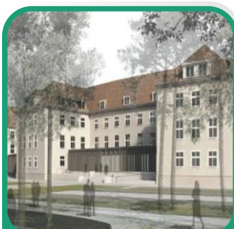
Agence fédérale pour l'environnement Berlin