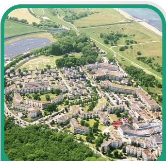
Parc de vacances et loisirs Weissenhäuser Strand